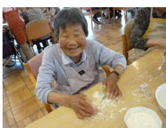
☺うすく伸ばして、あんこを包みます