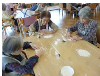
♡生地をよくこねます