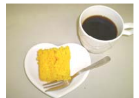
キャロットケーキ